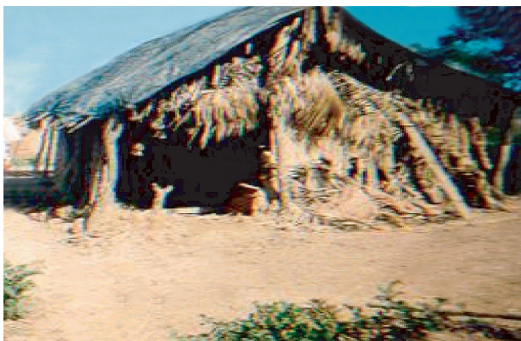
Figura 3. Casa antes da reconstrução

O laudo poderá ser único para todo o projeto, desde que sejam identificados todos os beneficiários. O projeto da nova unidade habitacional deverá seguir os parâmetros estabelecidos neste Manual.