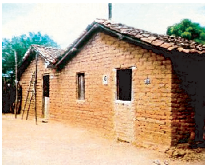
Figura 1. Casa antes da restauração