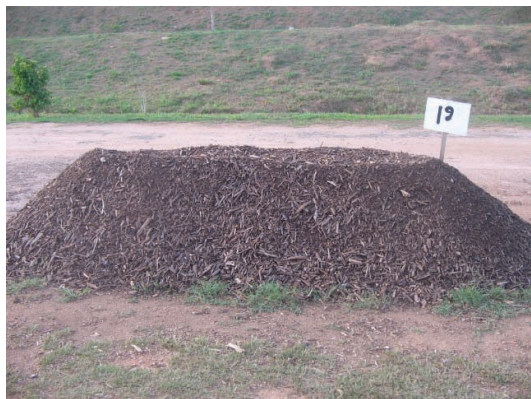
Figura 2 – Leira de compostagem, Parque socioambiental de Canabrava – Salvador, BA

Recomenda-se iniciar a montagem das leiras ou pilhas colocando uma camada de 10 cm de altura de podas ou galhos de árvores picados. É importante não formar camadas com um único tipo de material.