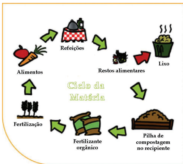
Figura 1 – Ciclo da matéria orgânica